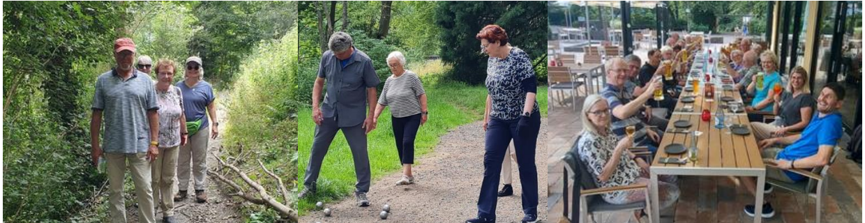
Freitag: kleine Wanderung – Boule-Spiel im Kurpark – Abendessen im Kurpark-Restaurant

alle 23 Eifelwanderer hatten ein sehr schönes und heißes Wochenende in Schleiden-Gemünd. Am Samstag ging es unter sachkundiger Führung eines Nationalpark-Rangers über Kloster Mariawald auf eine 17 km Rundwanderung. Hier einige Eindrücke: