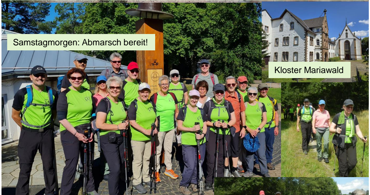
Samstagsmorgen: Abmarsch bereit!