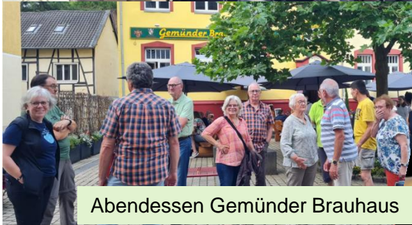
Abendessen Gemünder Brauhaus