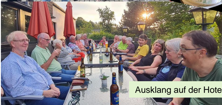
Ausklang auf der Hotelterrasse